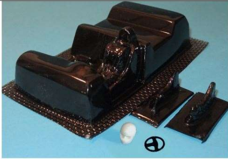
PRÍKLAD – povolený interiér - plná hlavička a 3d volant