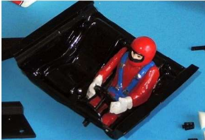
PRÍKLAD – povolený interiér s doplnkami MSH