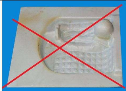
PRÍKLAD – povolený interiér s 3D hlavičkou