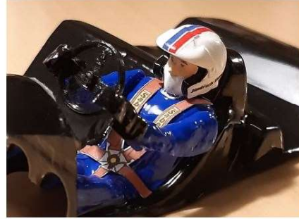
PRÍKLAD – doplnky MSH