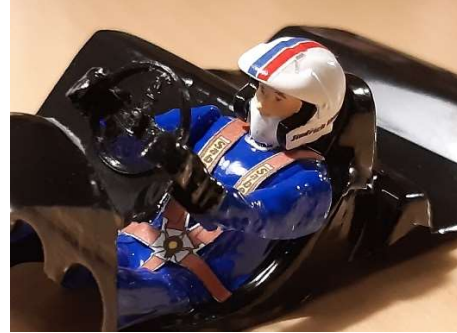
PRÍKLAD – doplnky MSH