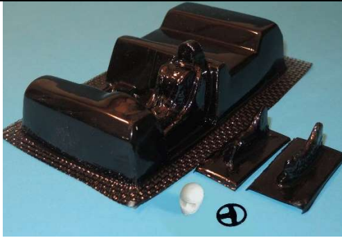
PRÍKLAD – povolený interiér - plná hlavička a 3d volant