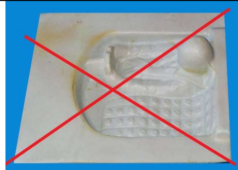
PRÍKLAD – povolený interiér s 3D hlavičkou