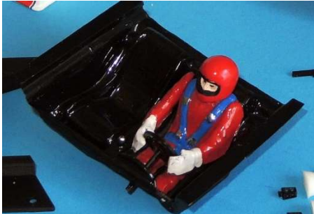
PRÍKLAD – povolený interiér s doplnkami MSH